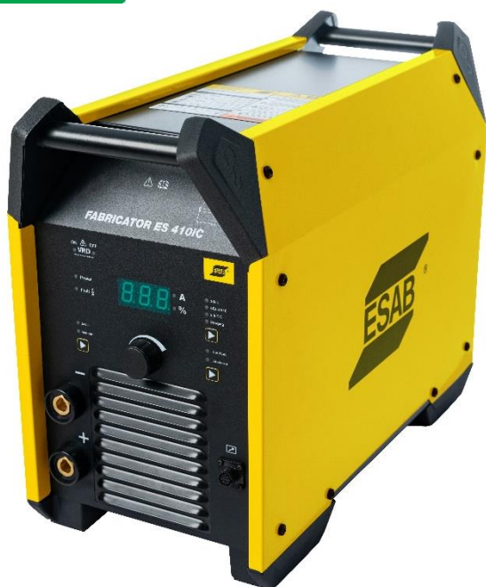
Fabricator ES 410iC

Fabricator ES 410iC es una fuente de alimentación de tecnología inversora para aplicaciones pesadas en los procesos SMAW (electrodos revestidos), GTAW (Live TIG) y ranurado por arco de carbono-aire CC. La Fabricator ES 410iC está construido para soportar un uso pesado, lo que lo convierte en una solución perfecta para uso industrial. Ideal para industrias pesadas que utilicen todo tipo de electrodos, incluido celulósico.