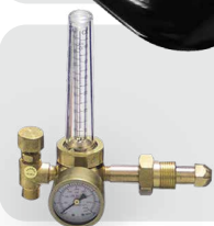
flujómetro de argón