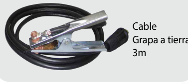
Cable Grapa a tierra 3m