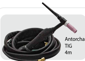
Antorcha TIG 4m