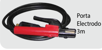
Porta Electrodo 3m