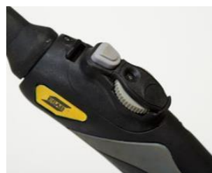
Antorcha con control de amperaje

Sólida, resistente con desempeño sin precedentes, la Rogue ET205iP posee características de arco excepcionales, ya sea en TIG HF, LiftTIG o en el modo electrodo. Lista para cualquier trabajo en cualquier lugar, es un equipo desarrollado para soportar las condiciones más adversas, entregando siempre un resultado perfecto.