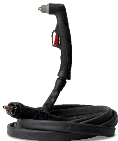
Antorcha HandyPlasma 60 A

Visite esab.com para obtener más información.